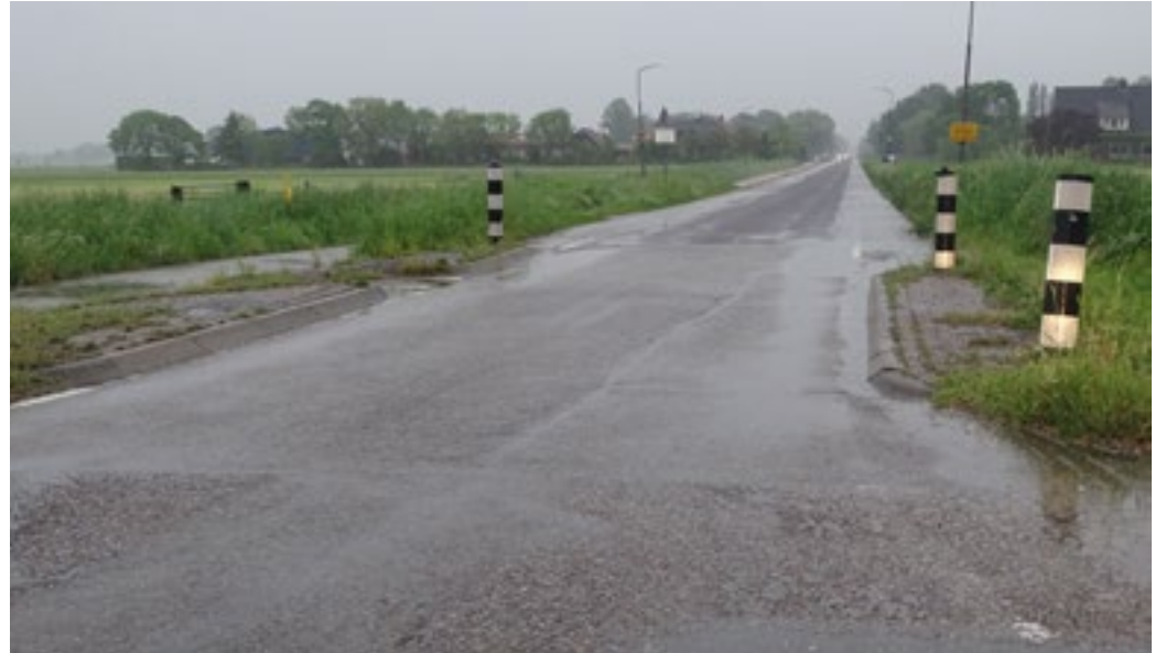
Foto: Middenweg vanaf het dorp

Wijdemeren kwam met 4 scenario's. Alleen het herinrichten op het maaiveld zonder damwand is 'niet maakbaar'. De plekken met stalen en