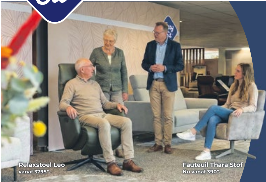
Relaxstoel Leo vanaf 3795*,-

Kom proefzitten bij dé specialist in Hilversum