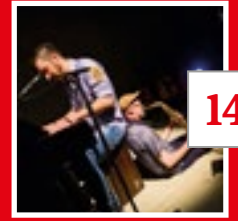
BRIDGECLUB 25 JAAR